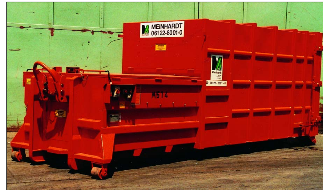
Selbstpresscontainer, PCS 20, geschlossen