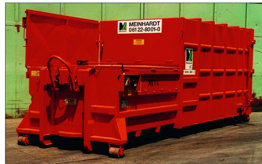
Selbstpresscontainer, PCS 20, offen