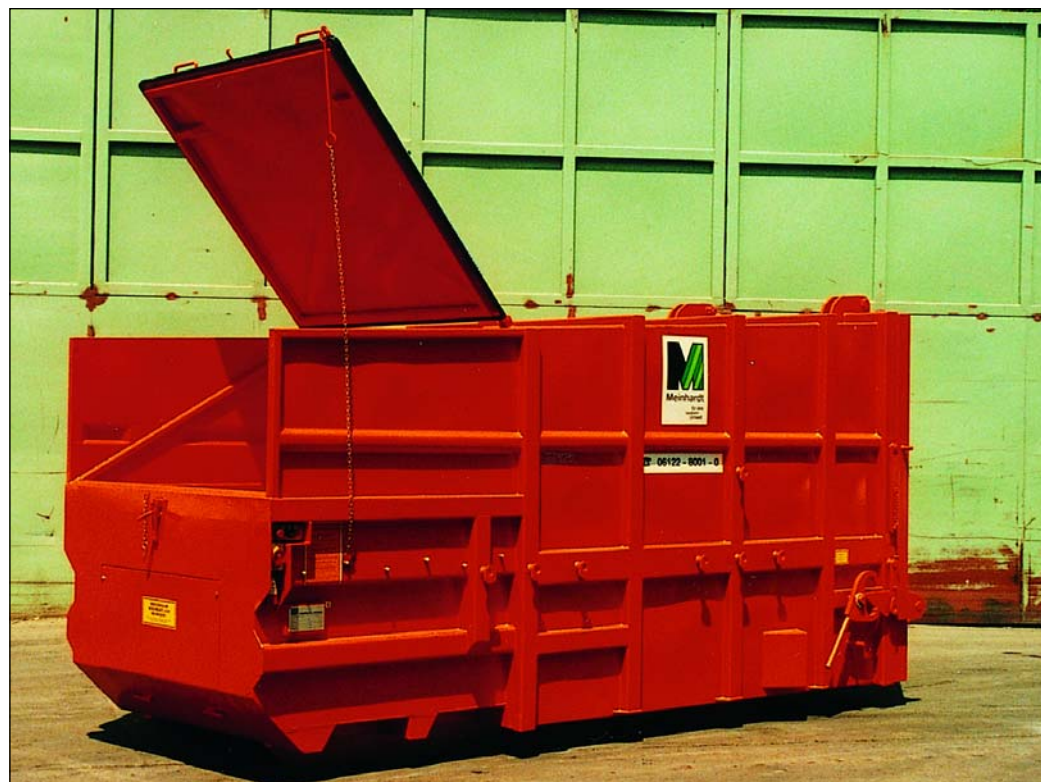
Selbstpresscontainer, PCA 10, offen