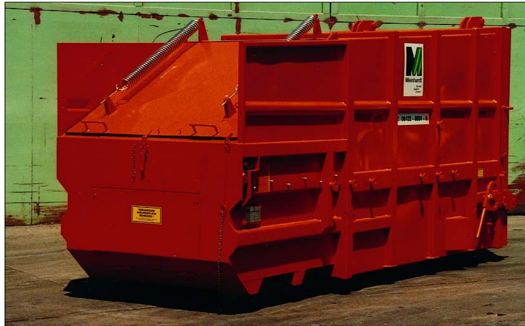
Selbstpresscontainer, PCA 10, geschlossen